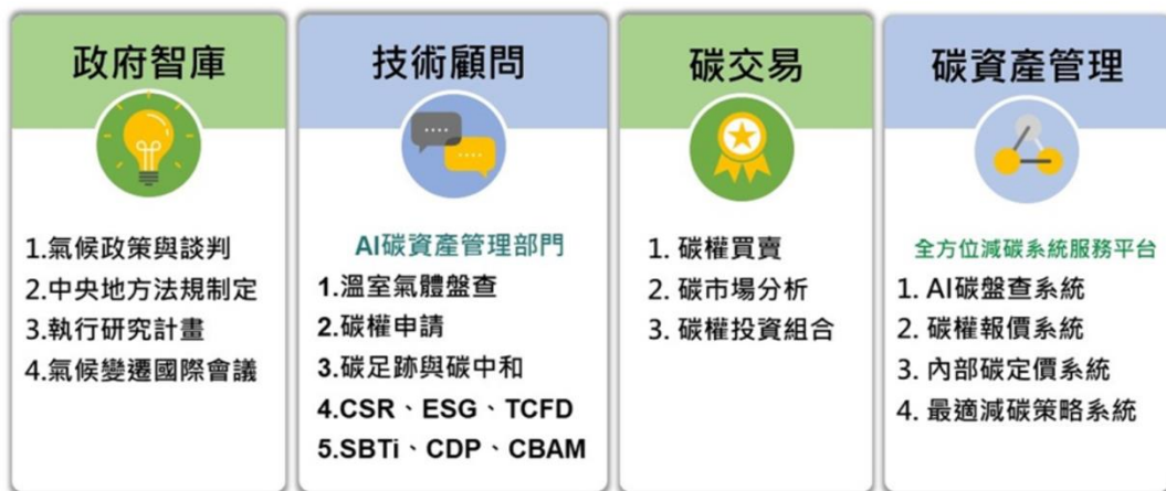
圖 2 永智顧問股份有限公司服務項目